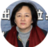
国家广电总局宣传管理司副司长王丹彦