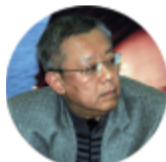
国家广电总局电视管理司司长李京盛