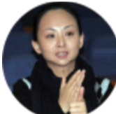
中国残联艺术团团长邵丽华