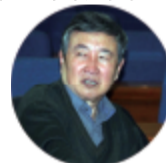
著名文艺评论家李准