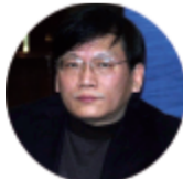
中国残联宣传部长王涛