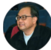
著名文艺评论家仲呈祥