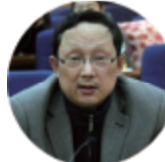
中国作协全委、理论批评委员会主任范咏戈