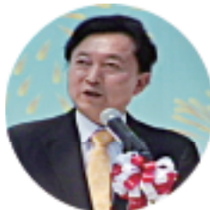
鸠山前首相在开幕式上致辞

作面临着大发展的有利时机,也面临着一些严峻的考验。值此中日邦交正常化40周年之际,我们要坚定中日和平、友好、合作信念,牢牢把握两国关系的正确方向,着眼两国关系大局和两国人民的根本利益,妥善处理各种复杂敏感问题,排除形形色色的干扰,推动中日关系沿着健康稳定的轨道向前发展。