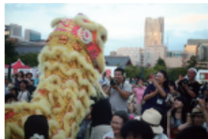
中国传统狮子舞的精彩表演很受欢迎

本次为期三天的2012东京“中国文化节”,以庆祝中日邦交正常化40周年为主题,以注重参与、体验为特色,是一次免费向市民开放的大型综合公益交流活动。文化节期间,举办了中国传统美食、民族歌舞、乐器演奏、武术表演、传统工艺、太极拳(下转本报3版)