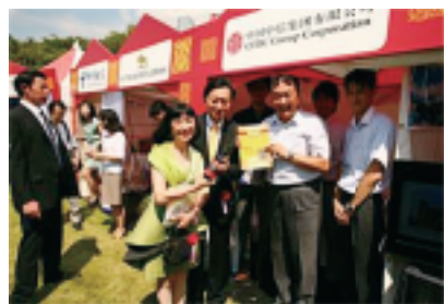
鸠山前首相参观文化节