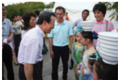
程永华大使夫妇参观文化节