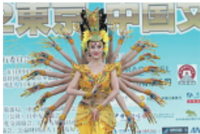
舞蹈《千手观音》深受日本观众喜爱