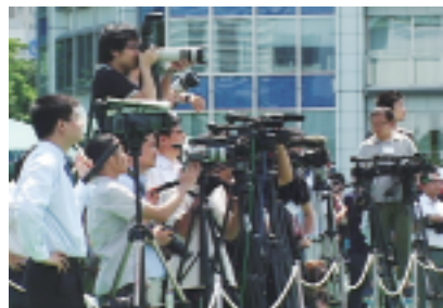
“中国文化节”受到日本社会各界关注