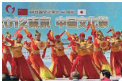
中国兰州歌舞剧团在开幕式上精彩演出