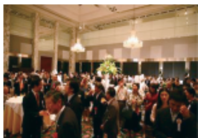
2012东京“中国文化节”招待会

本报讯: 为纪念和庆祝中日邦交正常化40周年,由在日华侨华人和中国企业共同主办,中国驻日本大使馆协办的2012东京“中国文化节”,