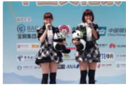
“中日国民交流友好年”形象大使、日本人气组合AKB48成员前来助兴