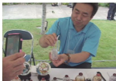
展示中国民俗工艺——鼻烟壶