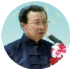
程永华大使在开幕式上致辞

程大使表示,中日两国互为重要邻国,走和平、友好、合作之路,符合两国和两国人民的根本利益。在新的国际形势和中日各自新的发展形势下,中日友好合