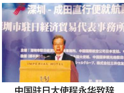
中国驻日大使程永华致辞

(本报讯) 9月25日,中国国际航空公司日本分公司、中国深圳航空公司、深圳市驻日经济贸易代表事务所,在东京帝国酒店举行招待会,庆祝首个“深圳和东京成田直航航班”即将开航,以及深圳市驻日经济贸易代表事务所成立十周年。