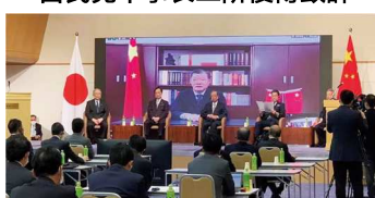
中国全国人大常委会副委员长陈竺致辞