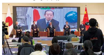
自民党干事长二阶俊博致辞