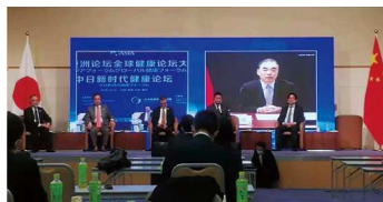
中国驻日本大使孔铉佑致辞