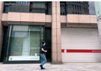
5月11日,东京银座的三越百货店临时停业。

对于民众及社会各界的防疫疲劳,日本政府对于本次延长东京等地紧急事态宣言修改了基本应对方针,在宣言对象地区不再要求大型商业设施停业,而是要求缩短营业时间至