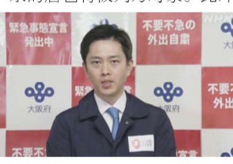
5月4日,大阪府知事吉村洋文召开记者会。