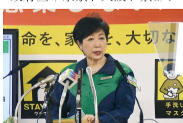
5月7日,东京都知事小池百合子召开记者会。

兵库自疫情爆发以来第三次进入紧急状态,目的主要是利用4月末至5月初的黄金周大型假期,通过一系列措施来抑制人员流动和聚集,从而抑制疫情蔓延。