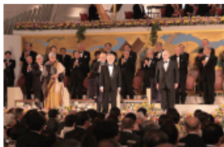
第二十八届京都奖三位获奖者在热烈掌声中登场

由京瓷公司创始人、名誉会长稻盛和夫先生于1984年创立的“京都奖”，被誉为“日本诺贝尔奖”。“京都奖”是表彰在科学研究、思想艺术等领域做出卓越贡献人士的国际性大奖，分为尖端技术、基础科学、思想艺术三大类别，每年评选颁发一次，获奖者将获得京都奖奖章与5000万日元的奖金。