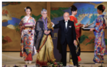
思想·艺术奖：授予哥伦比亚大学印度籍教授贾亚特里·查克拉沃蒂·斯皮瓦克