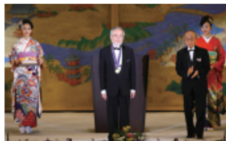
基础科学奖：授予日本东京工业大学特聘教授大隅良典(左二)