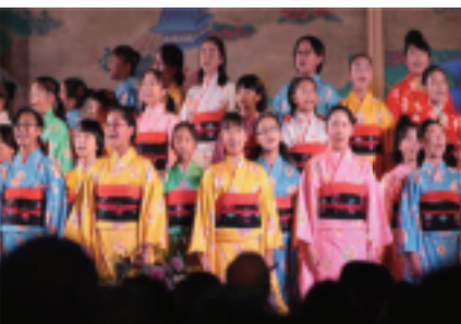
颁奖典礼上，京都圣母学院小学合唱团表演受奖赞歌：「夕焼け小やけ」「赤とんぼ」「青い地球は誰のもの」 编曲：千住明