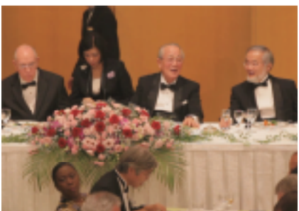
晚餐会上，京瓷公司名誉会长、稻盛财团理事长稻盛和夫先生(右二)与京都奖获奖者亲切交谈。