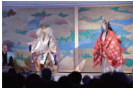
日本传统艺术“奉祝能”