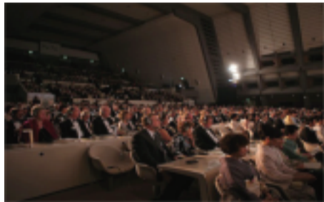
日本皇室成员高円宫妃久子殿下以及日本政府、经济、科技、文化、教育、外国驻日使节等各界嘉宾应邀出席