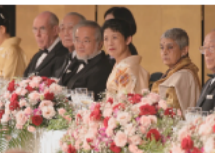
日本皇室成员高円宫妃久子殿下(右三)在晚餐会上与今年京都奖获奖者一起观看表演

公益财团法人稻盛财团会长井村裕夫先生致开幕辞。他表示，京瓷公司创始人稻盛和夫以其“为他人、为社会做贡献是做人最高尚行为”的理念，于1984年创立了稻盛财团和“京都奖”。28年来，稻盛财团奉行“京都奖”创立当初“推进科学与精神文化领域进步，促进未来人类社会稳定发展”的理念，表彰和支持(下转本报第3版)