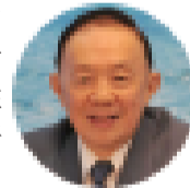
前驻日本大使 徐敦信

据中国驻日使馆官网消息，在《中日和平友好条约》签署35周年纪念日之际，中国外交部前副部长、前驻日本大使徐敦信(下接第3版)