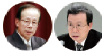
前首相福田康夫 程永华大使

今年8月12日是《中日和平友好条约》签署35周年纪念日。据新华网消息，中国驻日本大使程永华13日在东京会见日本前首相福田康夫，共同回顾两国老一辈政治家35年前缔结《中日和平友好条约》的历史，并就当前中日关系交换了意见。