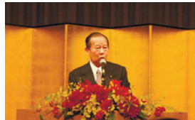
日中友好议员联盟副会长、自民党干事长二阶俊博

正将中日第四个政治文件关于两国“互为合作伙伴，互不构成威胁，相互支持对方和平发展”的共识落到实处，根据四个政治文件和四点原则共识精神坚持走和平友好、互利共赢之路。