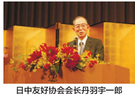
日中友好协会会长丹羽宇一郎