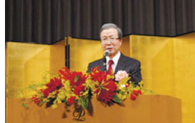
程永华大使出席并致辞

程大使表示，当前中日关系总体向好改善，但也面临一些复杂敏感因素的干扰，只要双方立足大局，慎重对待和处理那些高度复杂敏感的问题，两国关系就不会偏离改善轨道。近年政治安全互信成为制约两国关系的瓶颈，破解这一问题的关键在于摒弃过时的冷战思维，找准符合时代潮流与两国各自发展利益的相互定位，真