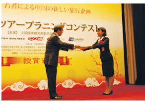
程大使和各位嘉宾为获奖选手颁发了获奖证书和奖品

场潜力巨大。2016年访日中国游客增长27.6%，达637万人次，访日本游客增长3.6%，达258万人次，双方人员往来接近900万人次。相信在不久的将来，两国人员往来千万人时代将来临，旅游将成