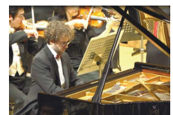
钢琴家塞尔吉奥·白塔

日本前首相福田康夫担任实行委员长,并到场观看演出。福田康夫在致辞中表示,希望吕嘉、白塔和东京爱乐交响乐团一起,心心相印,演绎美好之声,并借此传递中日日益发展的友情。他说:“我们要通过人类的共同语言——音乐,向世界传递两国的魅力,希望音乐的力量给大家带来活力和动力。”