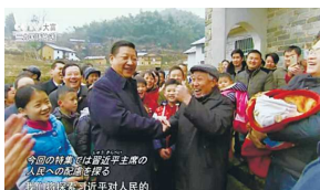
专题片《习近平治国方略：中国这五年》（日文版）

应日本首相安倍晋三邀请，李克强总理于5月8日至11日，赴日出席了第七次中日韩领导人会议并对日本进行