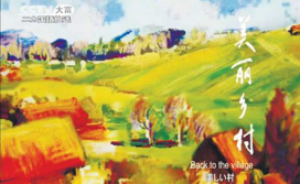
系列专题片《美丽乡村》（日文版）