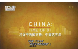
专题片《习近平治国方略：中国这五年》（日文版）