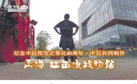
系列纪录片《上海，拉面激战物语》