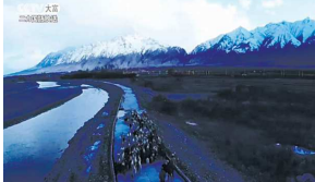
纪录片《对望—丝路新旅程》（日文版）