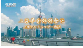
系列纪录片《上海，单亲妈妈物语》