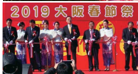
2019 大阪春節祭 中国驻大阪总领事李天然 出席开幕式并致辞