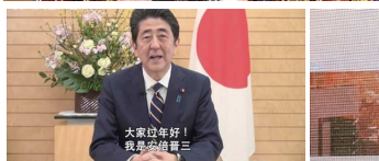
日本首相安倍晋三 特意于点灯仪式发来视频致辞

4 日大年除夕夜，采用日语同声传译、中日双语，向日本各界受众同步全程转播央视 2019 春晚盛况。【CCTV 大富】信号经日本主流三大电视频道播出平台，即日本唯一卫星电视平台“SKY PerfecTV！”、日本全国有线电视网“J:COM”、日本最大光缆网络高清电视频道“光 TV”的基本层播出，覆盖日本全国各地。这是【CCTV 大富】(转本报第 3 版)