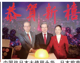
中国驻日本大使程永华、日本前首相福田康夫、文部科学副大臣浮岛智子共同点亮东京塔。