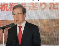
中国驻日本大使程永华 在点灯仪式上致辞

4 日大年除夕夜，采用日语同声传译、中日双语，向日本各界受众同步全程转播央视 2019 春晚盛况。【CCTV 大富】信号经日本主流三大电视频道播出平台，即日本唯一卫星电视平台“SKY PerfecTV！”、日本全国有线电视网“J:COM”、日本最大光缆网络高清电视频道“光 TV”的基本层播出，覆盖日本全国各地。这是【CCTV 大富】(转本报第 3 版)