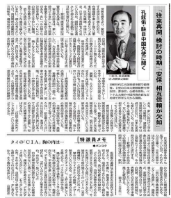
孔大使:新冠肺炎疫情打乱了中日双方今年一些既定的双边交往安排,很多外交日程也不得不延期。其中最重要的就是习近平主席对日本的国事访问。

孔大使:新冠肺炎疫情发生以来,中日间经贸和人员往来都受到较大影响,这是特殊形势下的无奈之举,也是世界各国面临的共同课题。同时也要看到,眼下的困难只是暂时的,两国经济依然有很