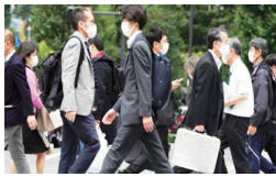
道、大阪府、埼玉县和神奈川县,其中埼玉县单日确诊114例创新高。

11月6日东京都新增确诊病例242例,连续两天超过200例,东京都累计确诊32135例。当日新增确诊病例超过100例的还有北海