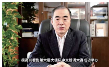
很高兴看到第六届大使杯中文朗诵大赛成功举办

大会直播现场。如其来,但日本各地华侨华人子女踊跃报名参加大会,感谢小朋友、家长、华文教师给予的重视和努力,期待参赛选手给大家带来惊喜和感动。本次大会由日本华文教育