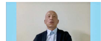
全日本华侨华人联合会会长贺乃和