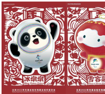
2022北京冬奥会吉祥物冰墩墩、雪容融

验。在这里, 你可以在冬奥“大咖”的指导下体验冰壶、冰球等时尚冰雪运动, 让自己的运动经验值继续翻倍。在这里, 你可以与“可爱到化”的冬奥吉祥物“冰墩墩”、“雪容融”来个亲密接触, 在手机中留下一张与冬奥“圣火”同框的难忘瞬间。在这里, “绿色、共享、开放、廉洁”的北京冬奥理念无处不在, 速度与激情的冬奥魅力在此尽收眼底。