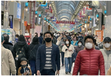
东京品川区某生活区商店街

症患者以及死亡人数不断刷新记录,日本政府宣布限制外国人入境的防疫措施到2月28日为止,不予以延长。从3月起分期放宽对外国人入境的限制。