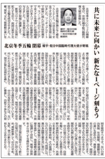
北京冬季五輪閉幕 楊宇、駐日中国臨時代理大使が寄稿

2022年北京冬奥会圆满落幕,中国为世界奉献了一场简约、安全、精彩的冬奥盛会。我们见证了日本花滑名将羽生结弦挑战极限,也为中国冬奥冠军苏翊鸣与日籍教练佐藤康弘的师徒情深所感动。衷心感谢日本各界友人对北京冬奥会的支持和祝福。从东京到北京,中日两国在全球疫情背景下成功举办两场奥运盛会,超越种族、国家、文化和价值观差异,生动诠释了“更快、更高、更强——更团结”的新奥林匹克格言。在疫情延宕不绝、全球性