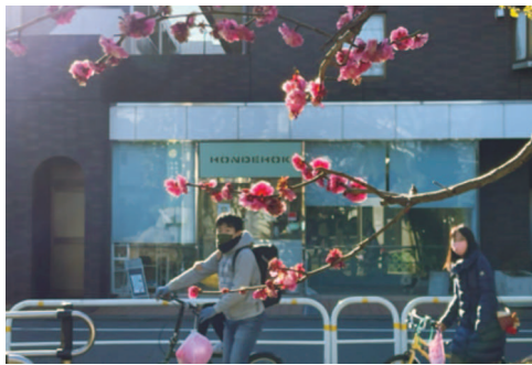
2月27日 东京品川区街头

去年11月,新冠变异病毒奥密克戎毒株在欧美等地迅速传播蔓延。日本政府为防止奥密克戎毒株传播颁布了限制所有外国人入境的严厉入境防疫政策。这项规定到今年2月28日到期,尽管目前日本疫情形势仍然严峻,单日新增确诊感染者数字在数万人高位徘徊,重